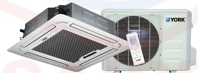
Cassette YTJE (18-48) - Sólo Frío