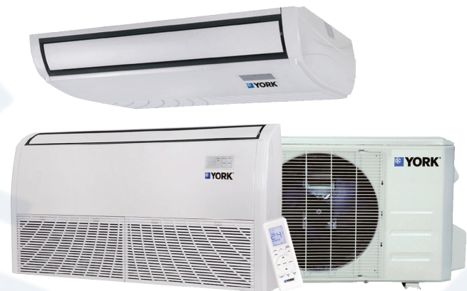
Piso Techo YFJE (18-48) - Sólo Frío

La condensadora (unidad externa) y evaporadora (unidad interna) están diseñadas para un funcionamiento silencioso.